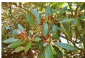
◀ 広い境内でシャクナゲの花殻をひとつひとつ手作業で摘む参加者たち