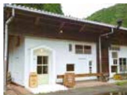
十津川なんばのPancake専門店 -Cafe じゃあよ-