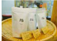
◀十津川村でうまれたオリジナルブレンドコーヒー「十津川ブレンド」